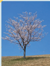
「東区青葉公園の一本桜」