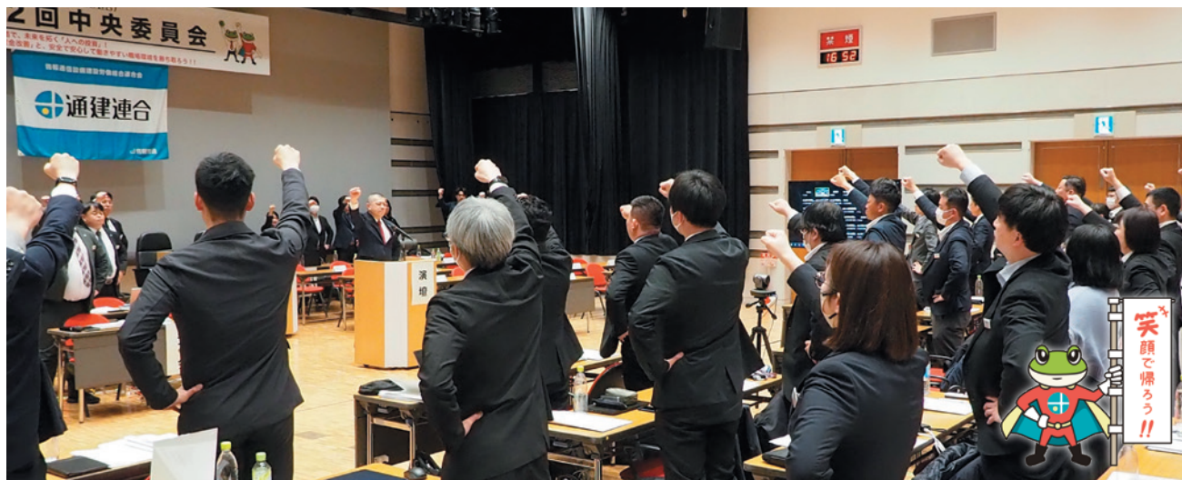
高代議長による団結ガンバロー