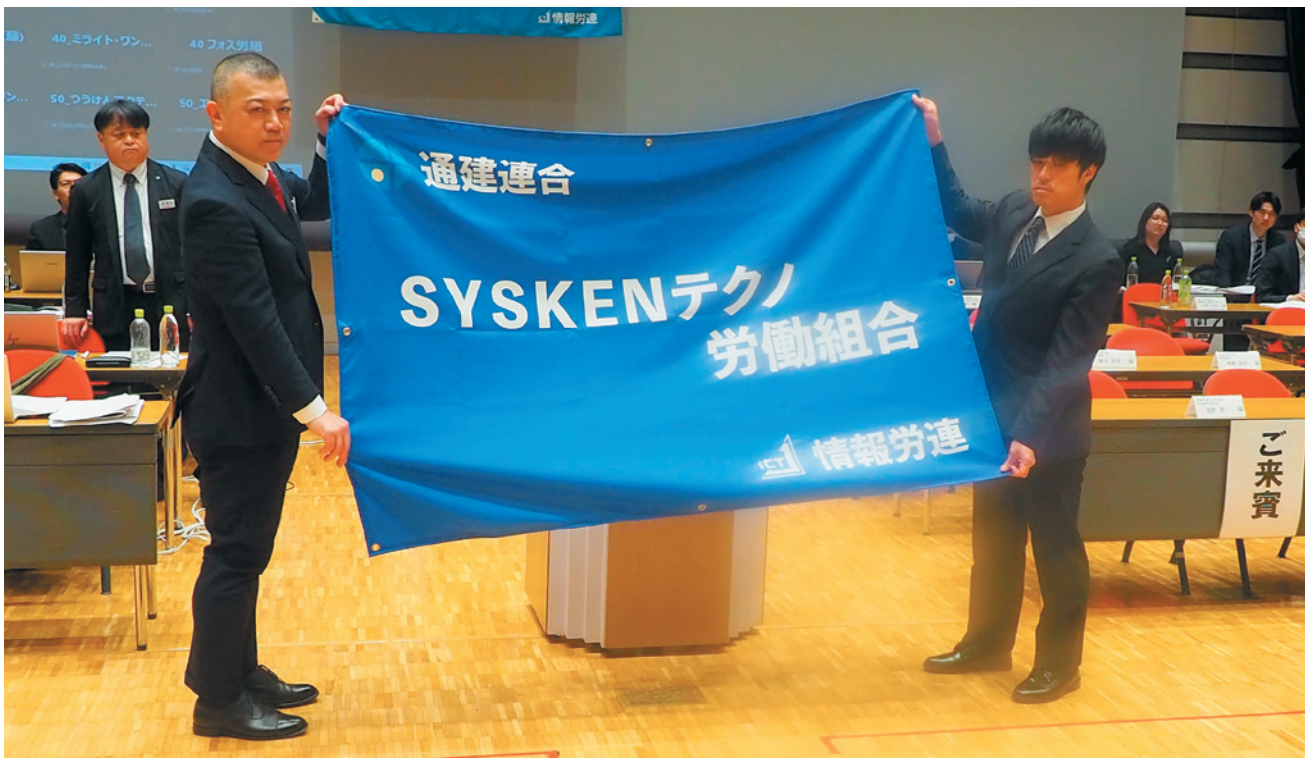
写真左：高代議長、同右：平川委員長