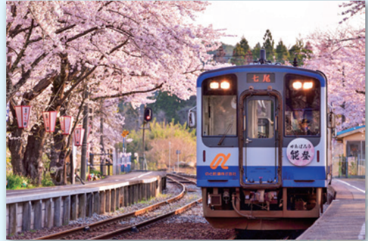
「能登鹿島駅、がんばろう能登」