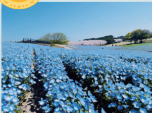
「福岡県福岡市東区 海の中道海浜公園」